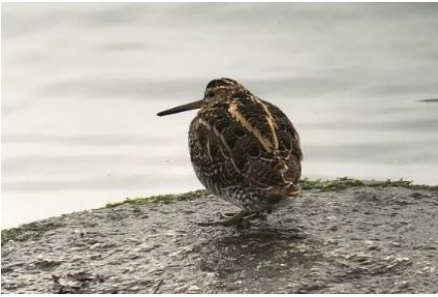
Wintergäste auf dem Rotsee 12.01.2019