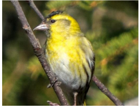
Zusammen mit dem SAC Pilatus und BirdLife Luzern