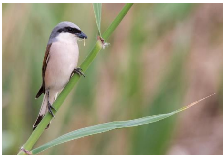
Herbstzug: Vogelrastplatz Wauwilermoos, 08.09.2018