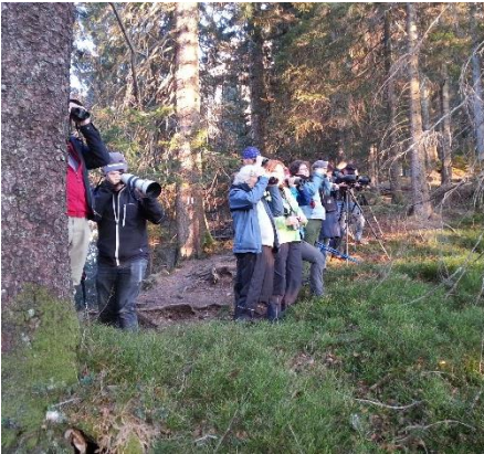
Pilatus-Weekend im Vorfrühling 30.03.2019