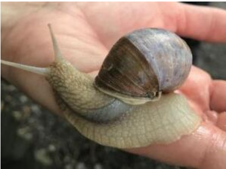
Schnecken entdecken 21.06.2019