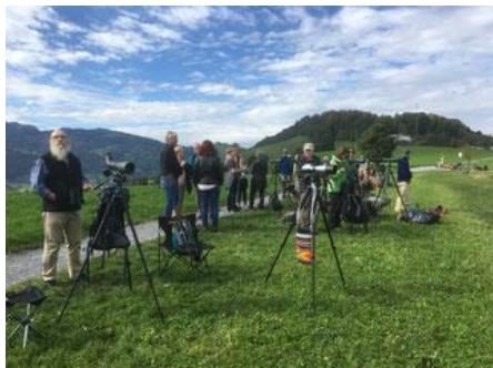
Euro BirdWatch, Sonnenberg 06.10.2018