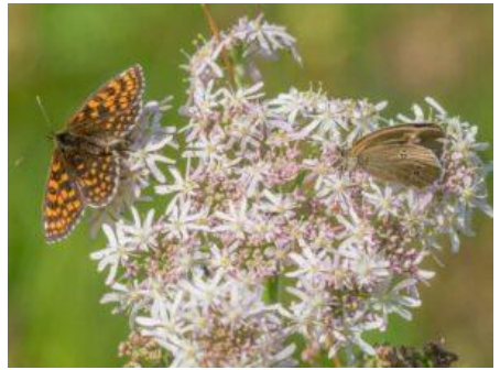
Faszinierende Welt der Schmetterlinge 13.07.2019