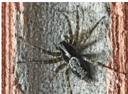
Abendspaziergang Spinnen in Kriens 10.09.2018