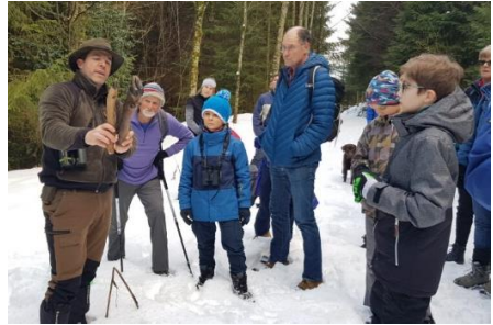
Spuren im Schnee – aber von wem? 02.02.2019