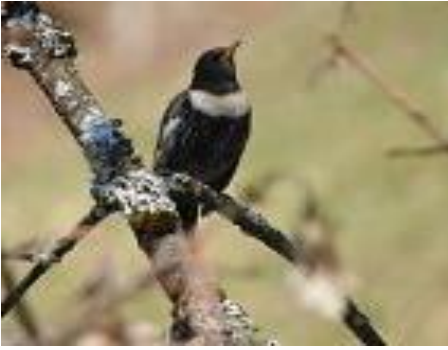
25. Mai 2019, Bergvogelexkursion am Pilatus