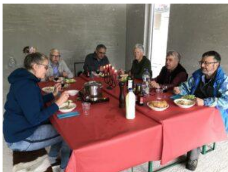
1. Arbeitseinsatz Zauneidechsenprojekt