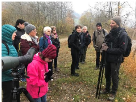
Eisvogel & Co. im Alpnacherried 27.10.2018